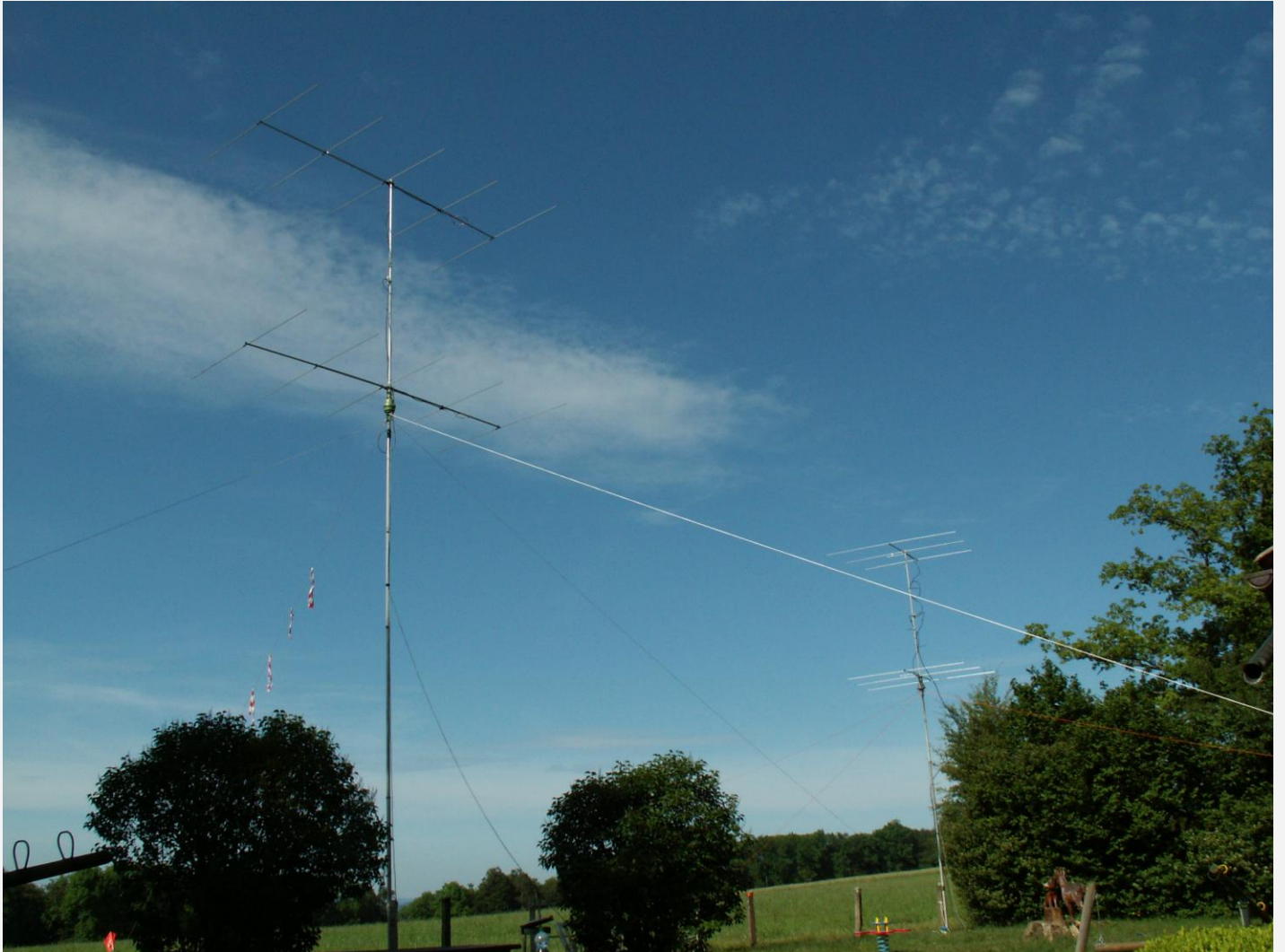
2x5 Element Yagi

HB9FMN: "With a stronger team of 6 operators now , 2 independent stack antenna systems (2x5el, 2x3el), SDR panoramic receiver, we were hoping to enjoy good propagation conditions . The evening before I easily worked 9K2/SP4R in Kuwait on CW. This was again not the case.... We have been happy to enjoy a couple of Es skips towards Eastern Europe, a multi-hop Es skip towards EA8. Fewer HB9 stations than last year unfortunately have been participating ( maybe World Cup effect...), very unstable opening towards Balkans on Sunday morning, only CW was going through the noise and QSB. We will be participating again next year, same setup but we will do more CW and will use more SDR technology.